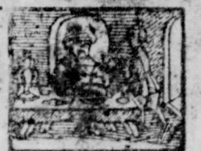
20. Sum: factu est reg num eorum. Mat. 29.