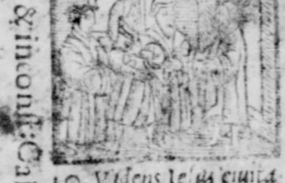
10. Videns Iesus euuata templa ier: Luc. 19.