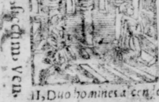
11. Duo homines a cen: e h: in templum. Luc. 18