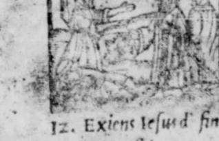
12. Exiens Iesus d. fini: bus Tyri & Sidon, Mar. 7

1 f Longi mar. 7 2 g Bibiana vir. 22 3 a Crispini 6 4 B Do. 2. Aduent. 20 5 c Sabæ Abbat. 24 6 d Nicolai Ep. 18 3.24. a.m. 7 e Vigilia 1 8 f Conc. B. Mat. 13 9 g Ioachim 26 10 a Eulaliae vir. 7 11 B Do. 3. Aduent. 19 12 c Damasi pa. 1 13 d Lucia vir. 13 Ianuarij 14 e Quatuor tem. 24 5.3. a.m. 15 f Nicasi Ep. 6 16 g Valeriani 18 17 a Lazari Ep. 0 18 B Do. 4. Aduent. 12 19 c Dagoberti 24 20 d Vigilia 7 21 e Thoma Ap. 20 22 f Sol in. 3 4.14. a.m. 23 g Solstitium 17 24 a Vigilia 2 25 B Nati. Iesu Ch. 1 26 e Steph. rot. 1 27 d Io. Ap. & Fuan. 16 28 e Inuoc. mar. 1 8.56. p.m. 29 f Thoma Ep. 16 30 g Dauid 0 31 a Syluestri pa. 15