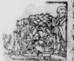
ni ex nobis arguet me to, Ioan, 8.