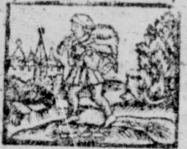
3. Erant appropinquan et ad Iesum. Luc, 15.