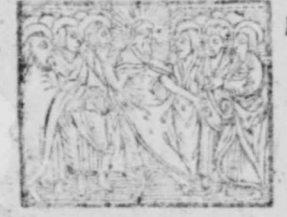
Ego sum pastor bonus, Iohannis 10.