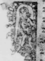
quasset Mat, 21.