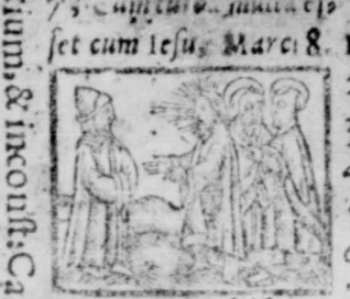
8. Attendite a falsis prophetis, Math. 7.

1 c Petri ad Vinc. 14 2 d Stephani pas. 26 3 e Inue: cor Ste. 8 3.29. p.m. 4 f Vigilia 21 g Mar. ad niues. 4 6 a Transgundo. 17 7 B Dom. nona 1 8 c Ciriaci 15 9 e Vigilia 29 10 e Laure. m. 13 6.7. p.m. 11 f Tiburtij mar. 27 12 g Clarae virg. 12 13 a Vigilia 26 14 B Do. Decima 11 15 c Assump. B. Ma. 25 16 d Rochi 9 Septemb. 17 e Sebaldi 23 p.m. 18 f Agapite 6 19 g Magni mart. 18 20 a S. Stephan. Re. 1 21 B Do. undecim. 14 22 c Oct. Assumpt. 26 23 d Vigilia 8 24 e Ber. h. A. Solin. 20 25 f Genesij mar. 3 8.25. a.m. 26 g Zepherini m. 25 27 a Oct. S. Stepha. 27 28 B Do. 12 Aug. 10 29 c Decoll. S. Io. B. 23 30 d Aducti 4 31 e Pauli Ep. 17