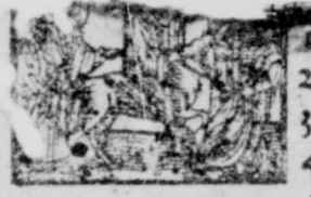
Dum transisset sabbatū Mariae Magdal. Mar. 16