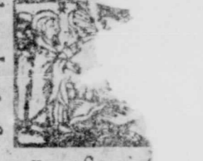
2. Erant signa in luna, Luc. 21.