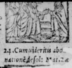
24. Cum uideritis abo- nationē desol: Mat. 24

25 f Chirlogon m. 25 g Cathetinae vir. 9 a Linia papa 23 B Do: pri Aduel. 8 c Soferi 23 d Vigilia 6 0.20. a.m.