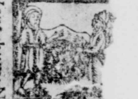
4. Miserant Iud. Hierosolimis, Io