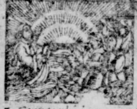
5. Cum turba irruerent in Iesum. Luc, 8.