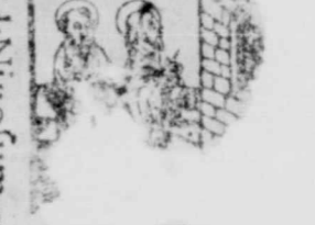
3. Cum disset in uinculis, Mat.