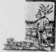
us Iesus recessit in 29ri, Math, 15.

21 c Valentini m. Math, 4 22 d Cather: S: Pet: 4 23 e Dies Cineru 18 24 f Matthe: Ap: 2 25 g Valpurgæ Vir 16 26 a Nestorius 1 27 B Inuocauit 16 28 c Romani Ab: 0