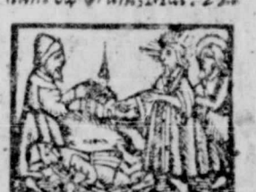
21. Erat quidam regulu cuius filius, Ioan, 4.