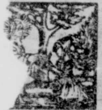
Iesus cisciens Da num. Luc, 11.