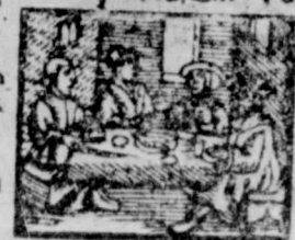
z. Homo quidam secut e nam in gra n. Luc, 14.

Tuli nter: fulgu: Calidif: Ven: Tonitru, fulgur ventu: cal: Varran: & inconf: Calidum & imb: Calidum, temp 75. Cum turba irruerent in Iesum. Luc, 8. 6. Nisi abundauerit ius stitia uestra, Mat, 5.