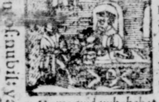
9. Homo quid ambabat uilicium, Luc. 16.