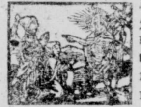
Cum esset serotino die u na sabbatorū, Io. 20.