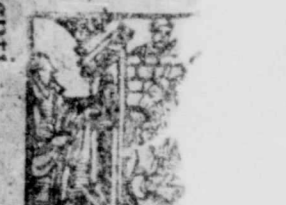
Exiit Iesus a Aug. 10, Luc.