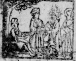
4. Estote misericordes sicut pater, Luc, 6.