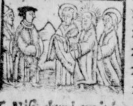
6. Nisi abundauerit ius stitia uestra, Mat, 5.